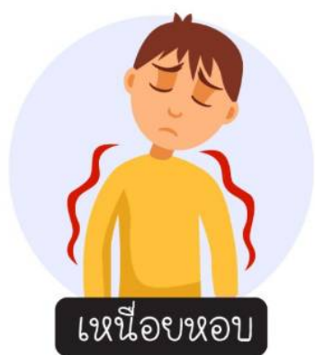
เหนื่อยหอบ

If you have one or more of following symptoms: fever, cough, sore throat,runny nose and shortness of breath after travelling from China within 14 days. Should see a doctor