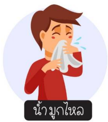
น้ำมูกไหล